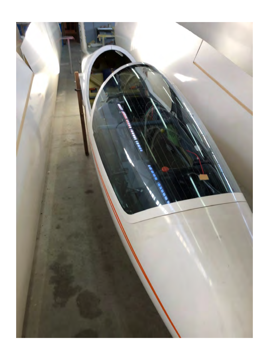
GENERAL: Aircraft not operative